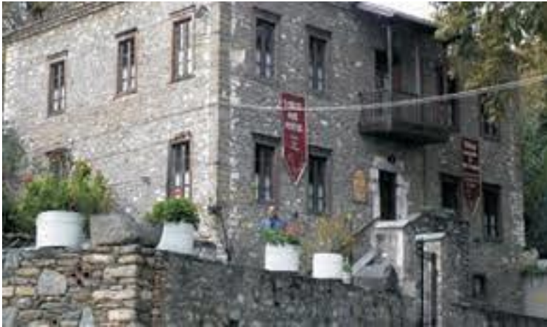
Το Πολιτιστικό Κέντρο