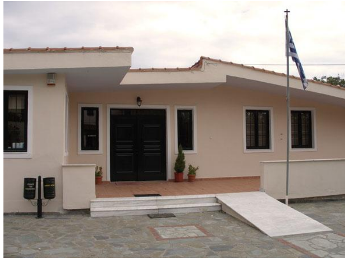
Η Είσοδος στο Αρχείο...